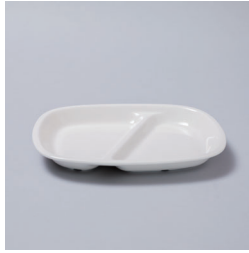
PLATE WIDE RIM / OUTDOOR

WIDE RIM : \varnothing 235 \times H33\text{mm}